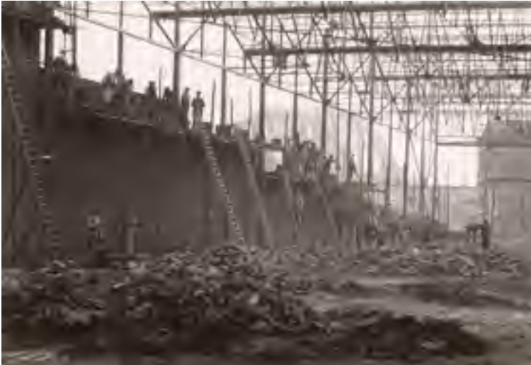
[Afbeelding: De groentehal in aanbouw met op de achtergrond de spoorwegbrug over de Leuvensesteenweg, vóór mei 1935.]

Nauwelijks vijf jaar later brak de Tweede Wereldoorlog uit, die ook in de Dijlestad zware sporen naliet. Van april tot juli 1944 voerden de geallieerde strijdkrachten verschillende bombardementen uit op spoorwegstations, bruggen en kanalen in en rond Mechelen om het transportnetwerk van de Duitse troepen uit te schakelen. De Centrale Werkplaatsen van de spoorwegen aan de Leuvensesteenweg vormden een belangrijk doelwit. Door onnauwkeurigheden of vergissingen werden echter heel wat omliggende woonwijken getroffen. Ook de woning van het echtpaar Verelst deelde in de klappen.