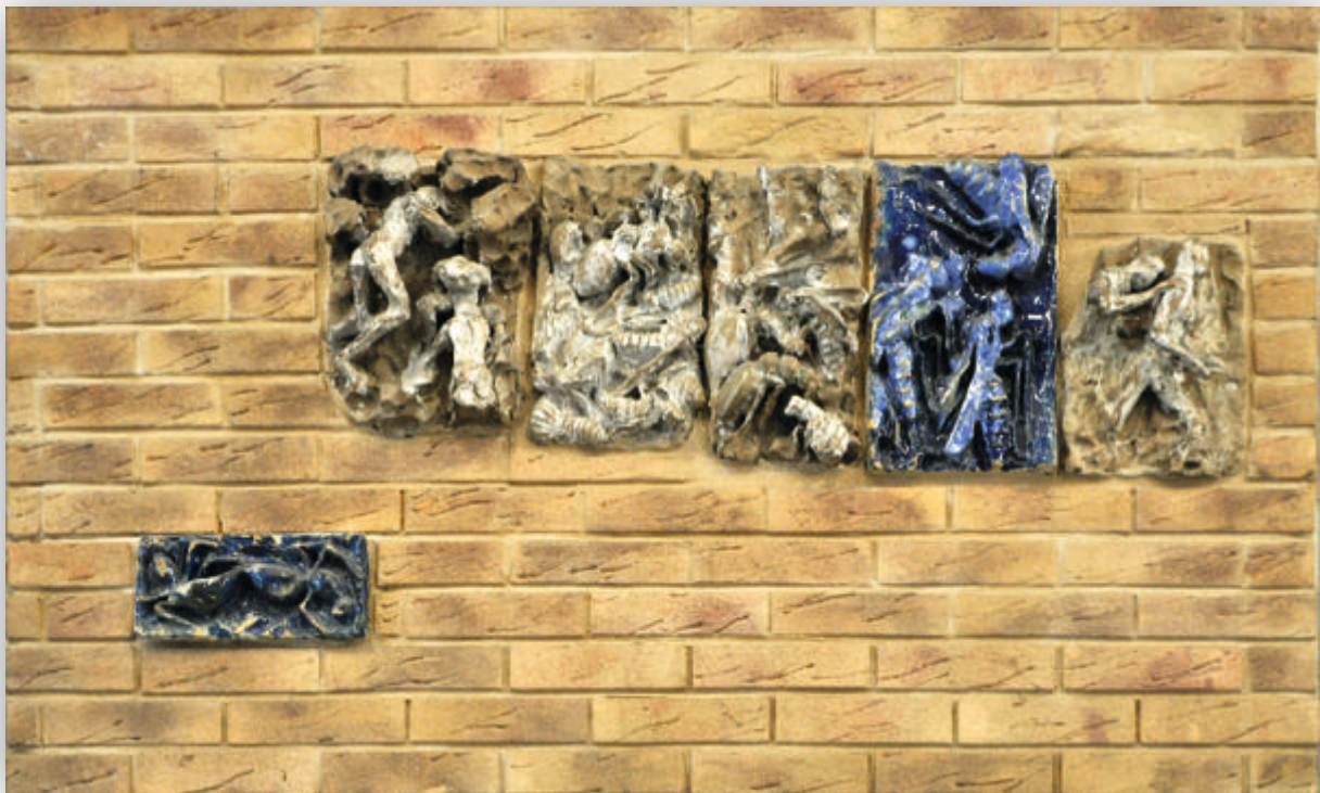
Afbeelding: Johan Creten, C'est dans ma nature , paneel 08, 2001, 6 elementen in geëmailleerd steengoed op imitatie baksteenpaneel, cement en hout, 88,5 x 153 x 15 cm

Zijn kunstwerk breekt met het conformisme en stelt de kijker voor existentiële vragen – wie, wat, waar, wanneer, waarom, hoe.