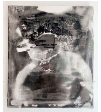
Casablanca, March 25, 2016