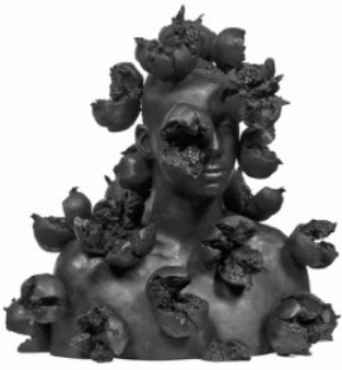
Of the Grenadier (2022)

noordwestkust van Amerika door de inheemse bevolking wordt gebruikt om de voorouders te herdenken. Door er paradijsvogelbloemen in te verwerken associeert de kunstenaar hiermee het vermogen om te vieren en het openstaan voor al wat vloeit en zindert van leven. De matzwarte afwerking van de paal roept vragen op over ras, verlangen, fetisj en zelfrepresentatie, vooral omdat de hoofden geboetseerd zijn naar het model van de kunstenaar.