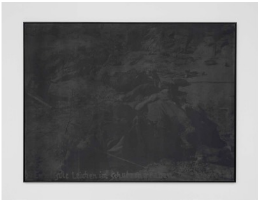
Of the Confused Memory – April 22, 1915

Open vrijdag, zaterdag en zondag, 14 – 18u